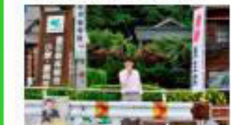
【地元での街頭活動】