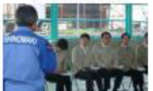
【産業界関係者からヒアリング】