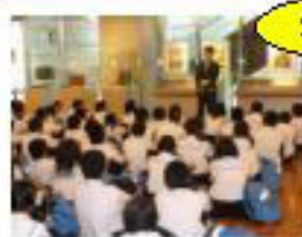
【豊田・みよし中学校の御会席】