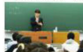
【日本大学法字棟にて講義】