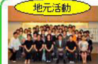
【たん任任会の皆様と】