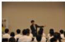
【母校上吉高校の皆様と御談話】