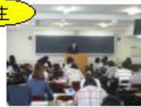
【中央大学法字棟にて講義】