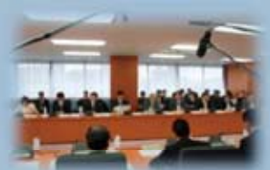
↑ 税制調査会 ← 日経新聞(12/4) 税調での議論は新聞でも連日報道