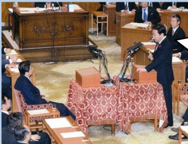
2012年11月14日野田総理と安倍自民党総裁の党首討論