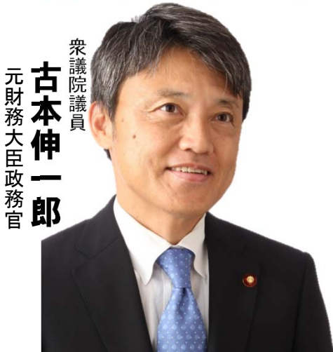
衆議院議員 元財務大臣政務官 古本伸一郎

今年生まれる赤ちゃんが、40歳になる平成67年頃には、 日本の人口は▲4,000万人減少 * 国立人口問題研究所調べ