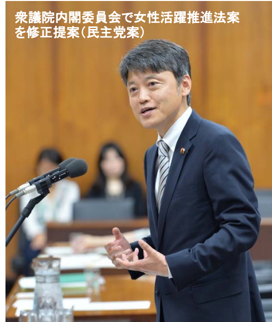
衆議院内閣委員会で女性活躍推進法案を修正提案(民主党案)